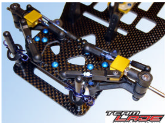
Team Lajes MH framvagn som är marknadens mest justerbara.

SpeedEvil har sedan sin debut 2004 vunnit både Svenska, Nordiska samt Franska mästerskapen. Nu har den blivit ännu bättre. Ta en extra titt på SpeedEvil2007 och bli en vinnare tillsammans med oss hos Team Laje.