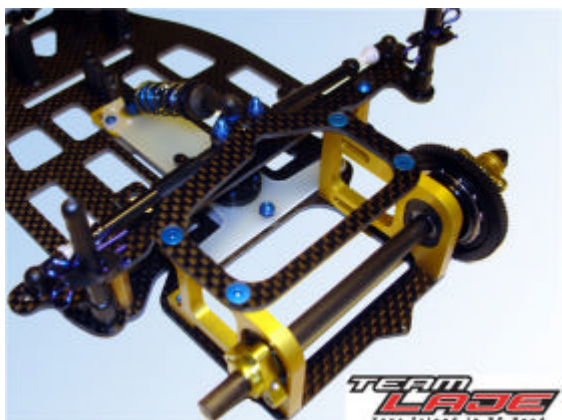
Team Lajes SpeedEvil2007 bakvagnsdesign med bakaxel och precisions drev från PRS.